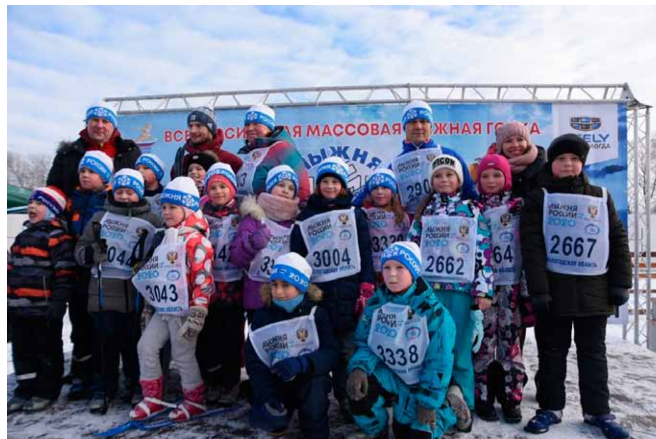
«Лыжня России 2020» - в Вологде