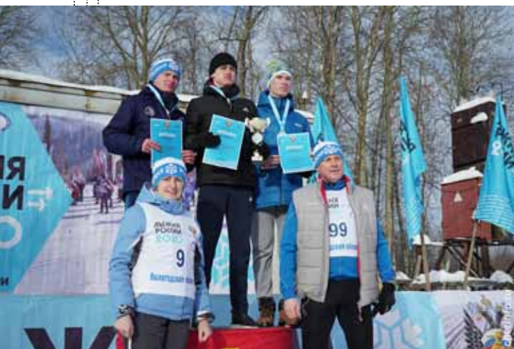
Соревнования в Череповце