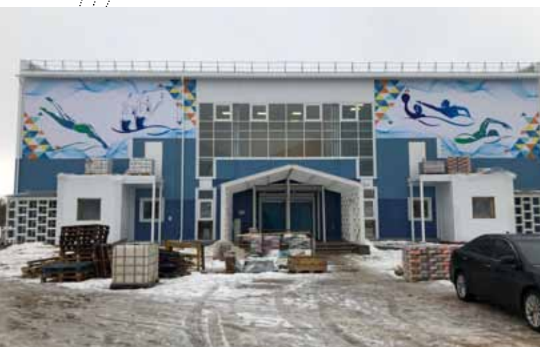
Строительство плавательного бассейна на стадионе «Витязь» в г. Вологда