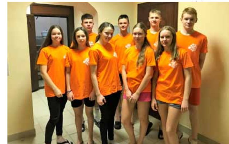
Участники Первенства России по лыжным гонкам