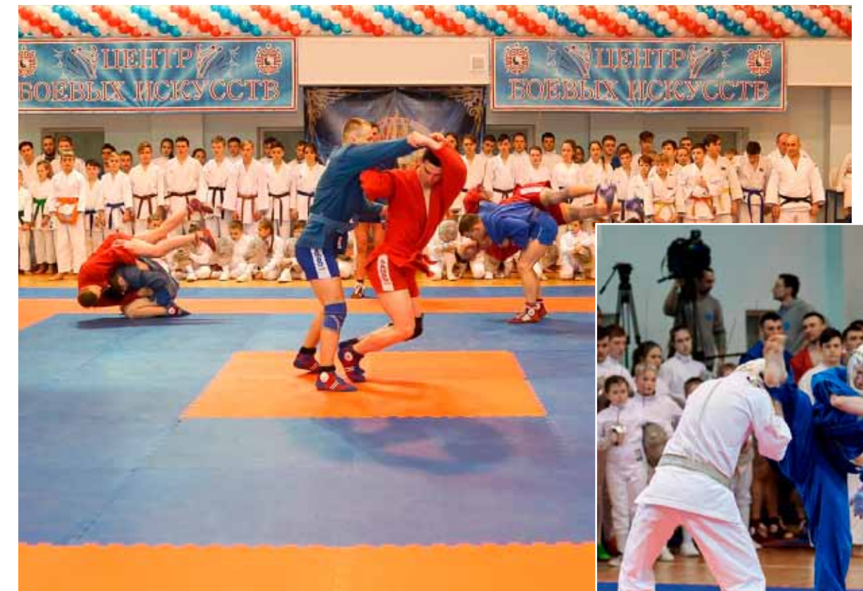
Показательные выступления отделения самбо (фото слева), кудо (фото справа)