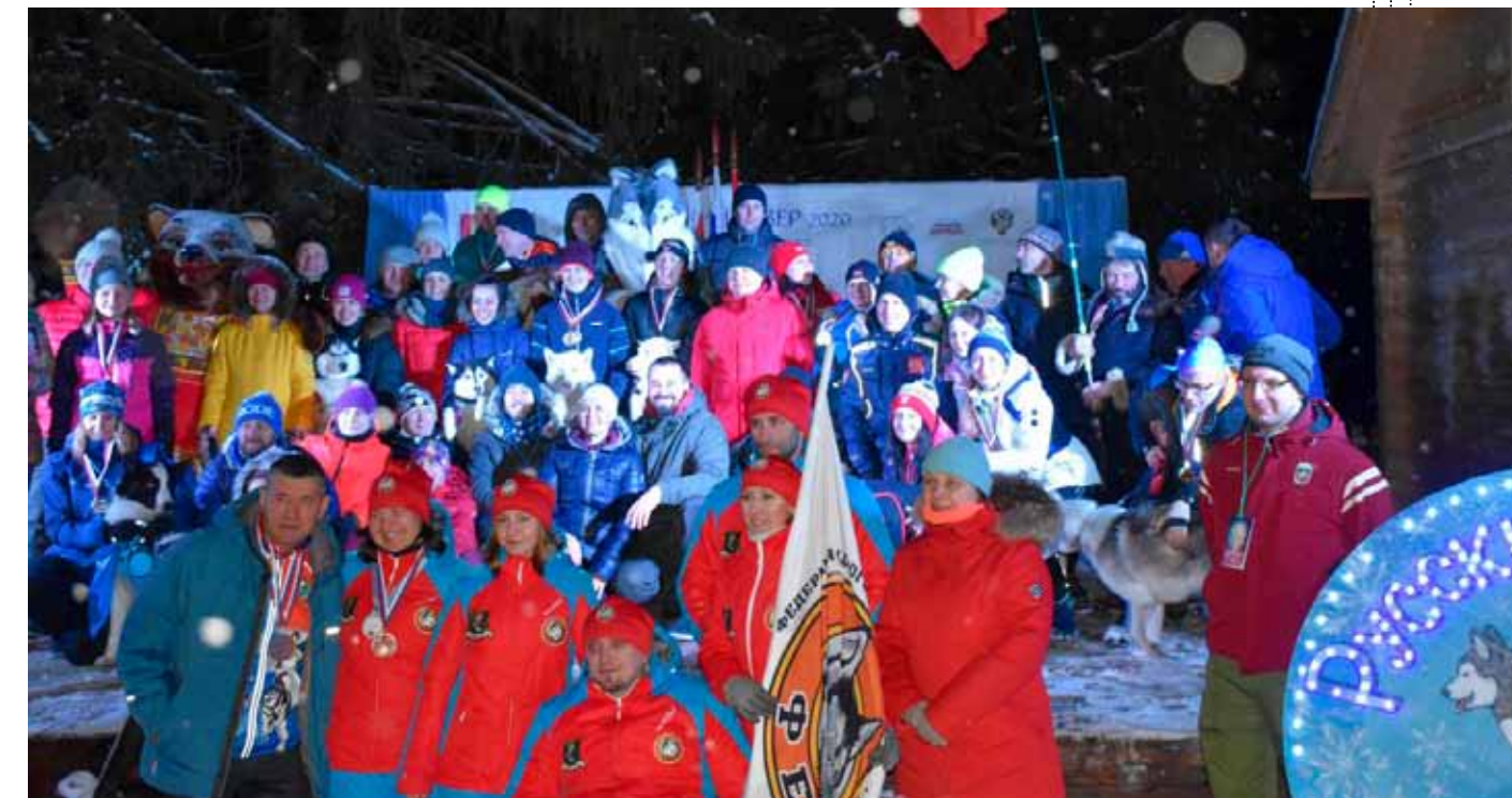
На закрытии соревнований