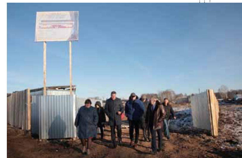
Универсальный спортивный комплекс появится в Кичменгском Городке