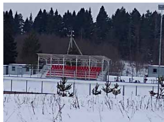
ФАКОТ в Карпово

Отметим, что в Вологодской области ежегодно увеличивается доля населения, систематически занимающегося физической культурой и спортом. За 8 лет она выросла почти в два раза (с 16,9% в 2011 году до 35,6 % в 2019 году). Успехи в развитии спорта в регионе стали возможны, в том числе, благодаря сотрудничеству с Министерством спорта Российской Федерации. Вологодская область является активным участником реализации мероприятий федеральных целевых программ Минспорта с 2005 года.