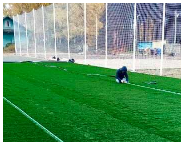
Завершены работы по капитальному ремонту легкоатлетического стадиона с футбольным полем в п. Кадуй.