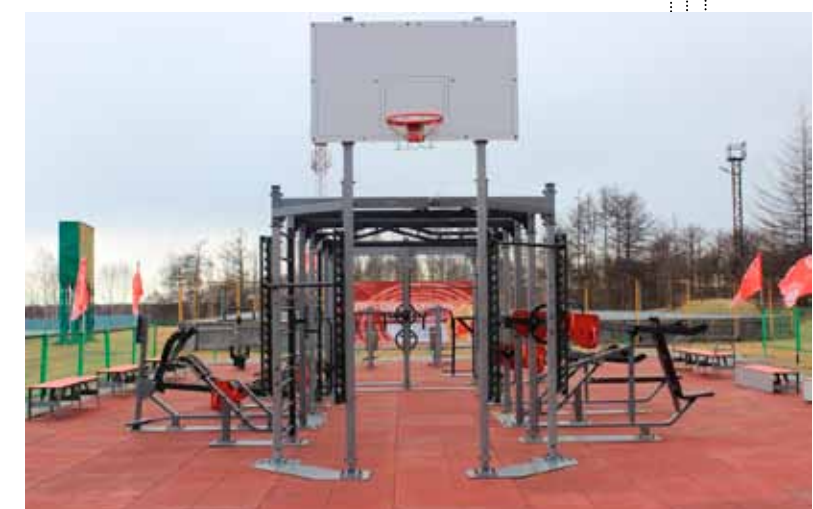
Площадка для выполнения норм ГТО