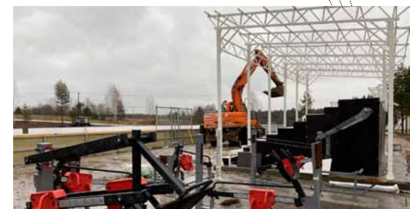
Введен в эксплуатацию физкультурно-оздоровительный комплекс открытого типа в д. Карпово Череповецкого муниципального района