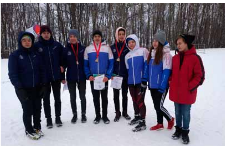
Команда Вологодской области по спортивному ориентированию