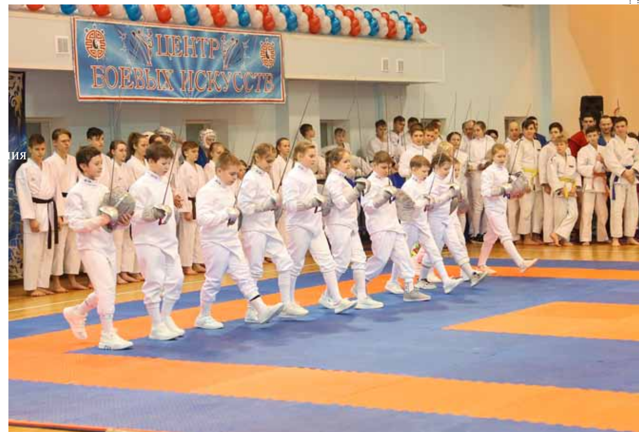
Показательные выступления отделения фехтования