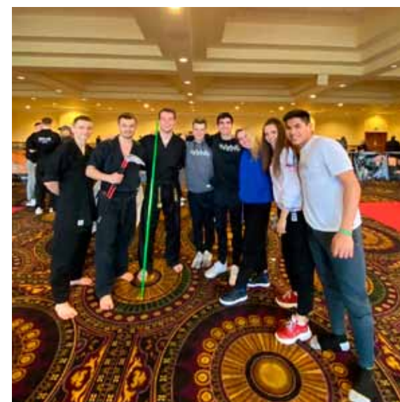
С американской командой paul mitchell team на прошедшем в Ирландии кубке Мира по кикбоксингу «Irish Open» 2020, г. Дублин