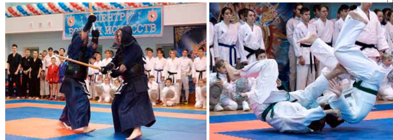
Показательные выступления отделения кендо (фото слева) и дзюдо (фото справа)