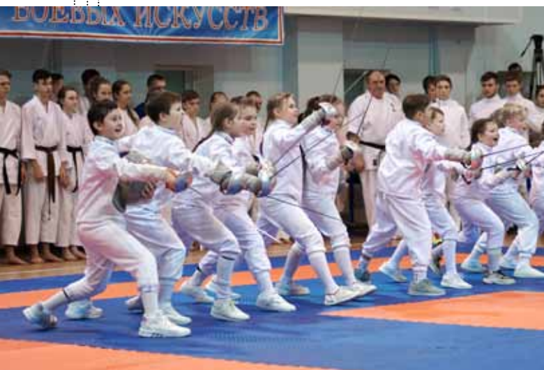
Показательные выступления фехтовальщиков