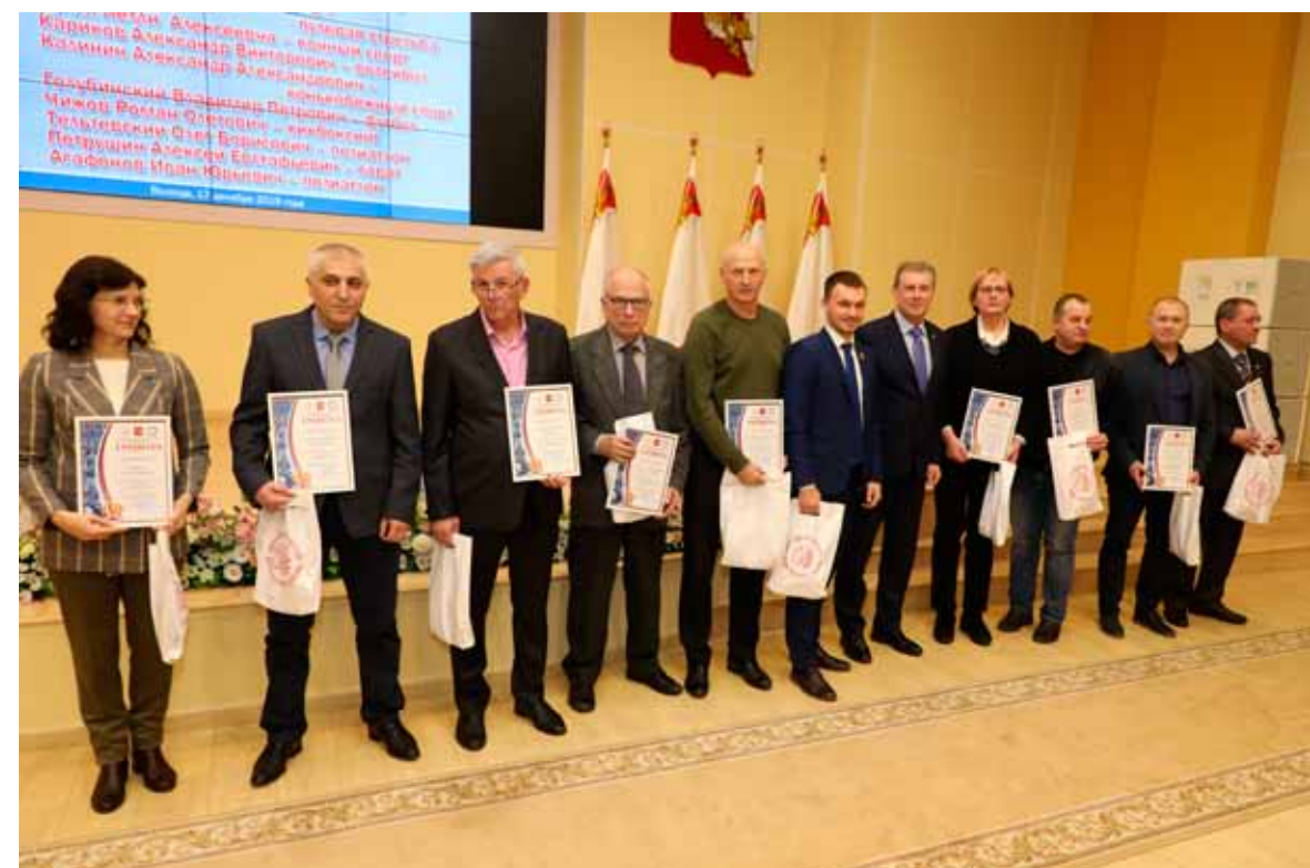
Победители в номинации «Лучший тренер года»