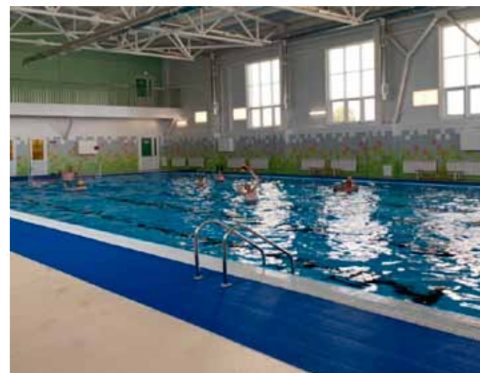
В новом ФОКе Вытегры «Мариинский» открыт плавательный бассейн.