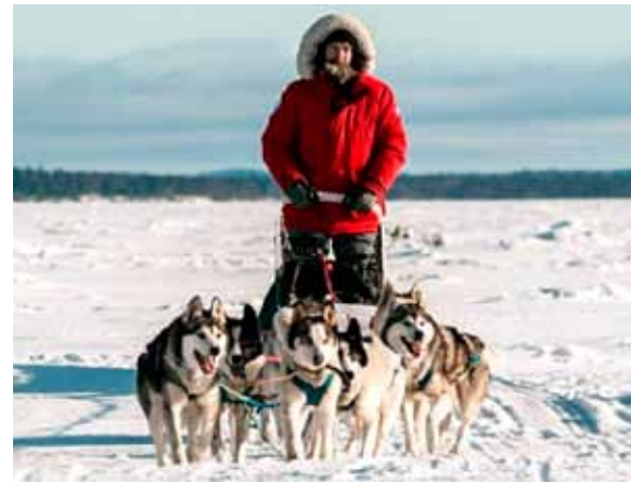
Путешественник Фёдор Конюхов