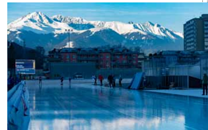
Австрийский центр зимнего спорта – Инсбрук