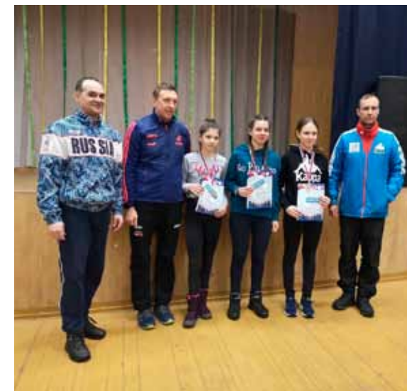
3 этап Кубка Вологодской области. СОК «Изумруд». Февраль 2020 года