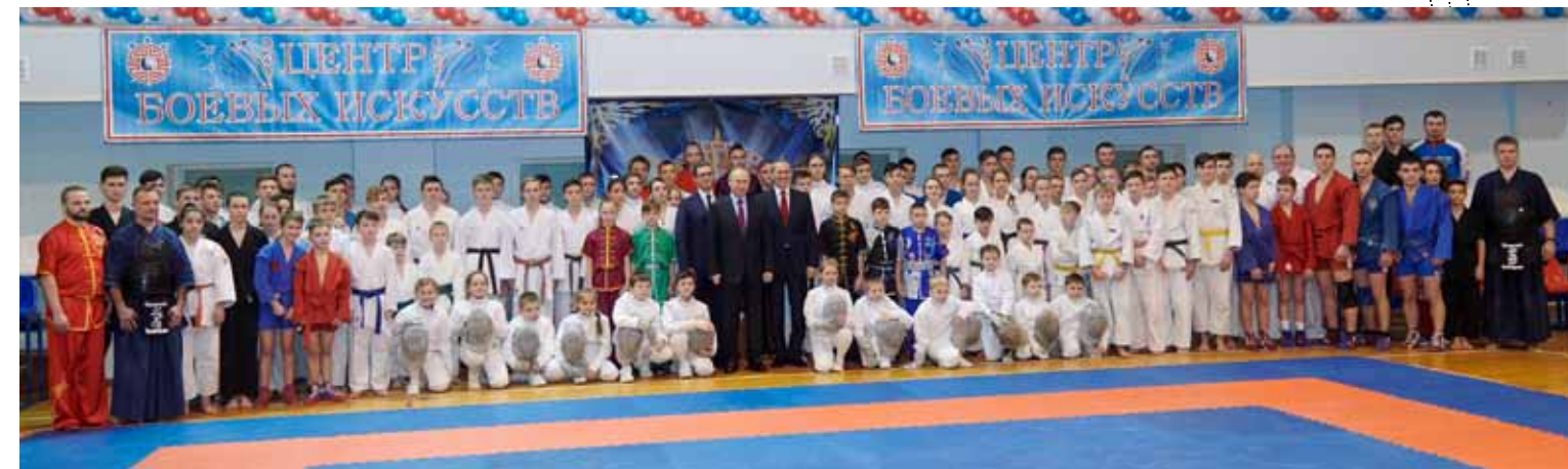
Фотография на память