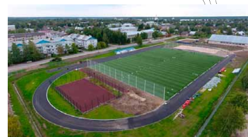
В Кириллове завершился капитальный ремонт стадиона «Чемпион»

За последние четыре года количество базовых видов в регионе удалось увеличить с трех в 2015 году до 16 в 2020 году. Согласно приказу Министерства спорта РФ от 26 декабря 2019 года №1117 «Об утверждении базовых видов спорта», с 2020 по 2022 годы в этот список вошли: баскетбол, волейбол, пулевая стрельба, конькобежный спорт, лыжные гонки, хоккей, спорт лиц с интеллектуальными нарушениями, спорт лиц с поражением опорно-двигательного аппарата (ОДА), спорт слепых, полиатлон, футбол, легкая атлетика, дзюдо, бокс и спортивное ориентирование.