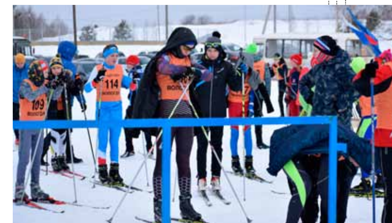
В ЦЛСиО «Карпово»