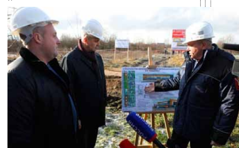
В Череповецком районе началось строительство современного спортивного комплекса

С 2020 года на Вологодчине к 16-ти имеющимся видам спорта добавили пауэрлифтинг, он будет базовым видом до 2024 года. Его финансирование со стороны областного бюджета увеличится вдвое. Напомним, признание вида спорта базовым позволяет увеличить финансирование, в том числе и за счет средств федерального бюджета. Муниципальный район, где развивается базовый вид спорта, может претендовать на субсидию для подготовки спортивного резерва сборных команд области. На эти цели в 2020 году предусмотрено 32,6 млн рублей.